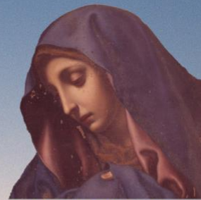
シドッティ神父が持ってきた 聖画「親指のサンタ・マリア」